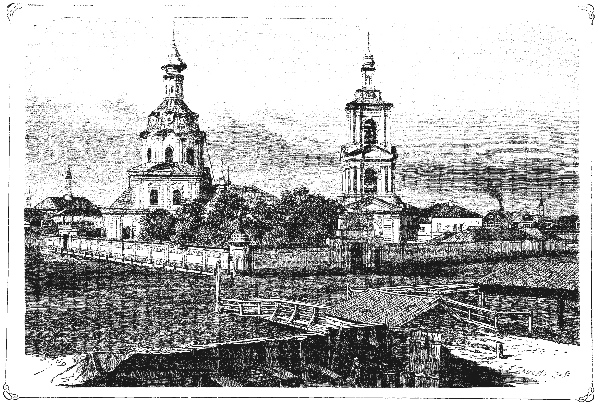
СТАРОБРЯДЧЕСКИЙ МОНАСТЫРЬ ВЪ КАЗАНИ.