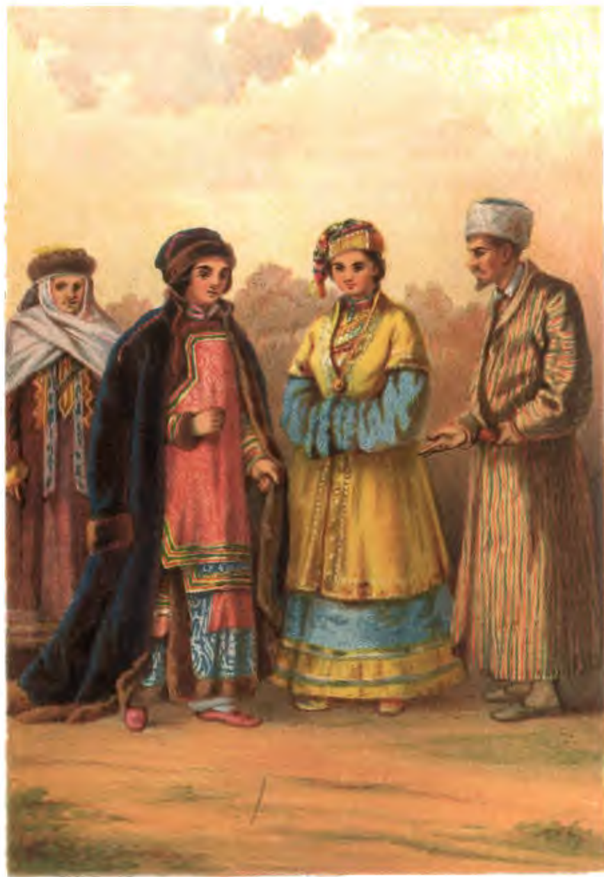
СИБИРСКІЕ И ВОЛЖСКІЕ ТАТАРЫ