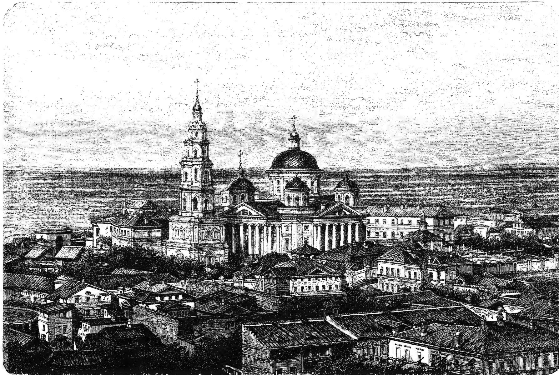
ВИДЪ ПРАВОСЛАВНАГО МОНАСТЫРЯ ВЪ КАЗАНИ.