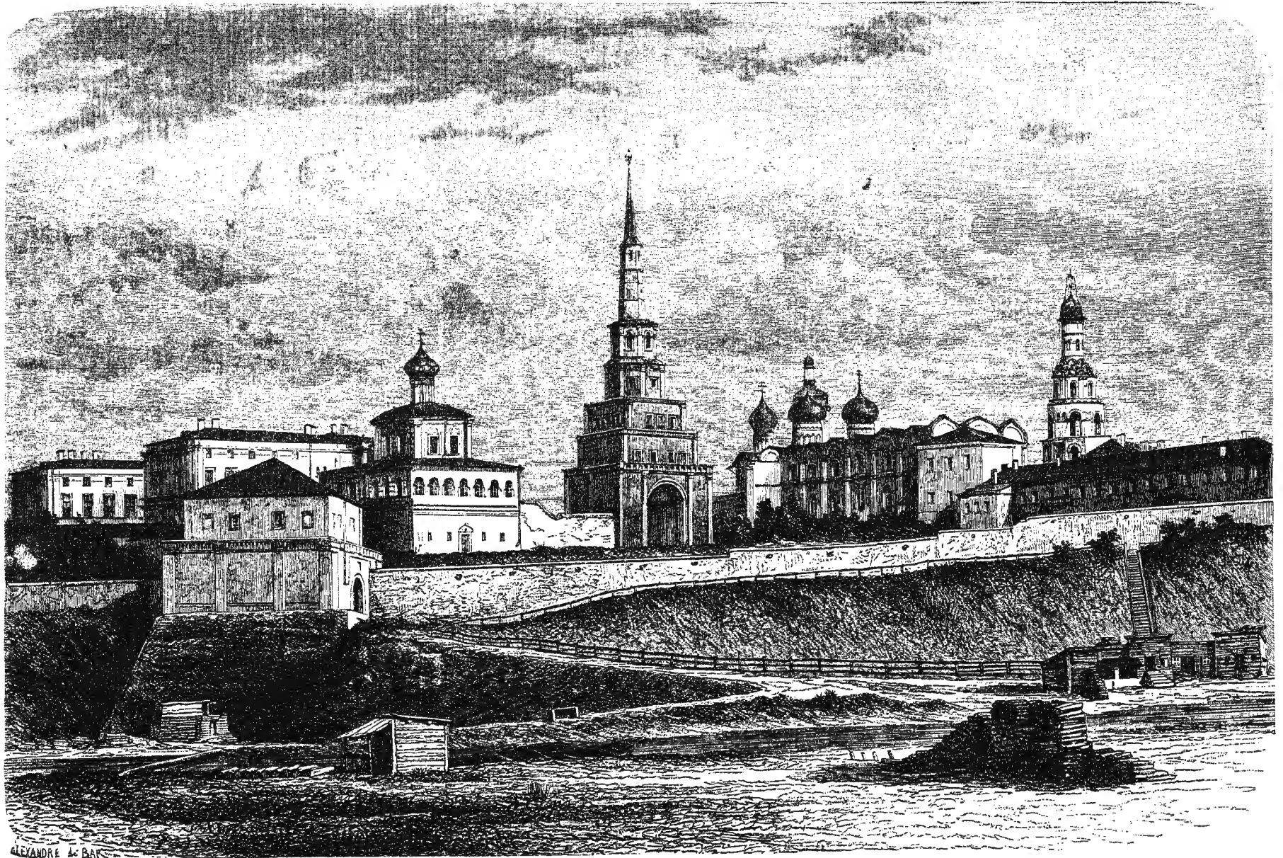
НИЖНИЙ НОВГОРОДСКИЙ КРЕМЛЬ.