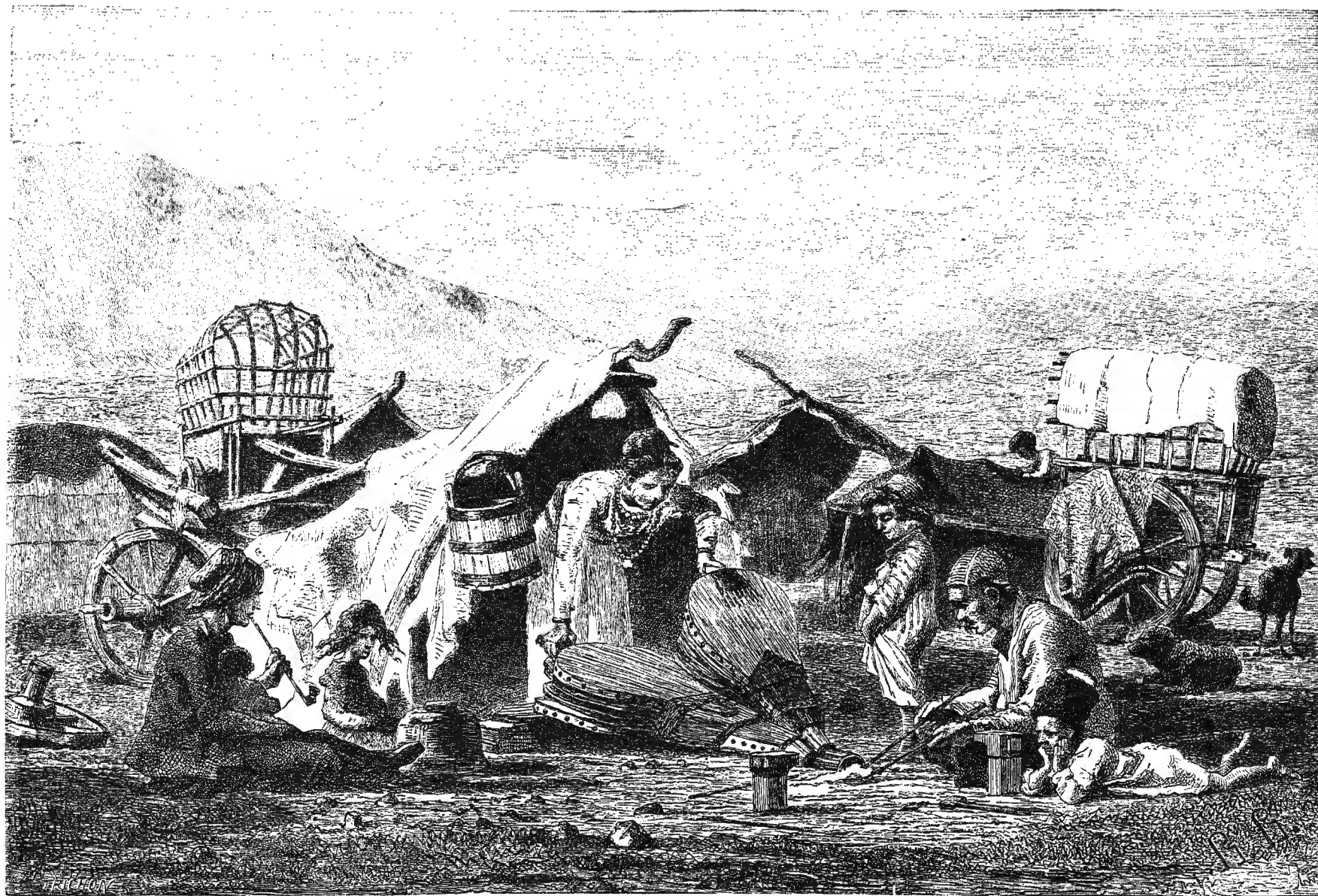
ТАВОРЪ КАВКАЗСКИХЪ ЦЫГАНЪ.